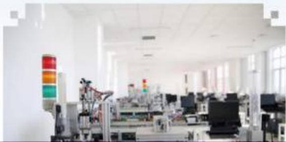
自动化生产线安装与 调试训练场所